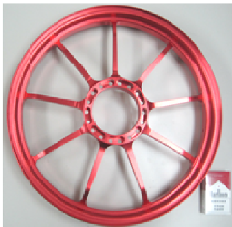
16インチ・ALホイール ワイド・リム (55mm) 約 1600-1650g