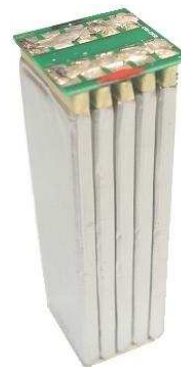
超高エネルギー密度 Lipo バッテリー 新型 スポット溶接不要!!

モジュール化済のユニットなのでハンダ作業だけで簡単 接続バッテリー組みが簡単に出来ます。