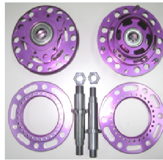
ハブキット ハブ + ロックリング クロモリ シャフト ピン、ナット、ベアリング等