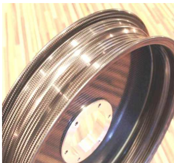
16インチ・CFホイール 超ワイド・リム (76mm) 約 1600-1700g